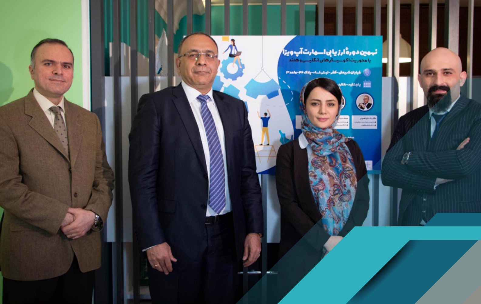
تصویر از نهمین دوره برنامه ارزیابی ایده های استارتاپی